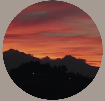
La "Bella Addormentata", catena montuosa del Gran Sasso d'Italia